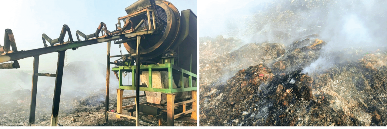
हरिभूमि न्यूज ▶▶हरदा

सूचना देने के ढाई घंटे बाद फायर ब्रिगेड पहुंची, सीएमओ बोले आग लगने के कारणों की जांच की जा रही